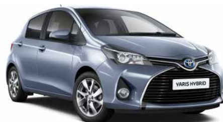
8S7 Modrá - ledová*