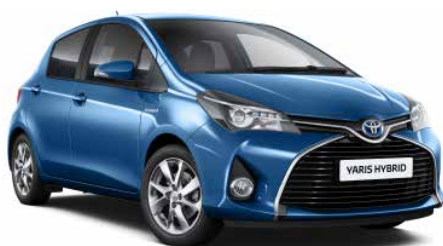
8T7 Modrá - ostrovní*