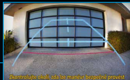
Zkontrolujte okolí, zda lze manévř bezpečně provést

Barevný obraz zpětné kamery na displeji pomůže snáze se orientovat při couvání a včas zahlédnout skryté překážky a tím bezpečněji zaparkovat vzad.