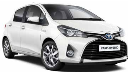
084 Bílá - ledovcová**