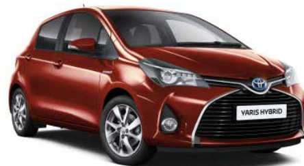
3N8 Červená - plamenná*