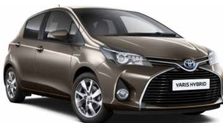
4V8 Bronzová - Avant Garde*