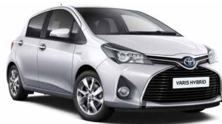
1F7 Stříbrná - saténová*