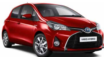
3P0 Červená - ohnivá