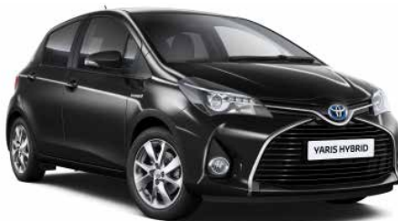
209 Černá - noční obloha*